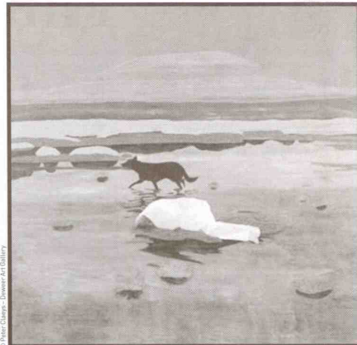
'Stalking Hiëronymus', olieverf op doek, 2002.