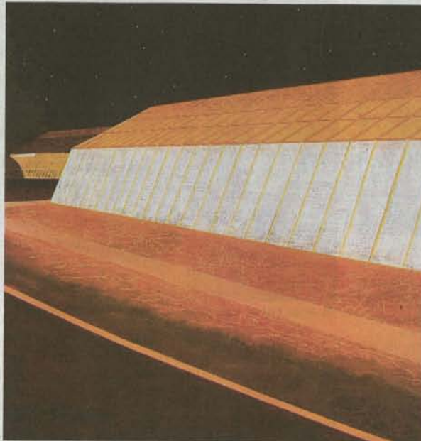
■ The Light Within , 2006.

Een ander belangrijk thema in het werk van Vandekerckhove is de menselijke blik. De mensen die hij afbeeldt, kijken je haast nooit aan. Ze richten hun blik op oneindig, hebben de ogen gesloten of zijn verdiept in een boek. De reeks Viewmaster is een mooie synthese, met het apparaat met de stereofoto's als het symbool van de verinnerlijkte blik. Vandekerckhove: "In je jongenskamer kijk je naar de wereld buitenaf en je verinwendigt dat zicht. Het zet meteen je verbeelding in gang - en daar is het ook mij om te doen." Het is ook geen toeval dat de schilder zichzelf afbeeldt op die schilderijen, net zoals het niet toevallig is dat hij op schilderijen als She's a Rainbow en Mind Games zijn dochter portretteert. "Ik schilder dingen en mensen waar ik een emotionele band mee