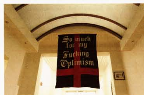
TONY GARIFALAKIS 'SO MUCH FOR MY FUCKING OPTIMISM' CUT FELT AND GLUE. DIMENSIONS: 120 X 190 CM

Tot 11 juli in Galerie Sans Titre, Barthélemylaan 22, 1000 Brussel, Open wo-za 14-18, www.galeriesanstitre.be