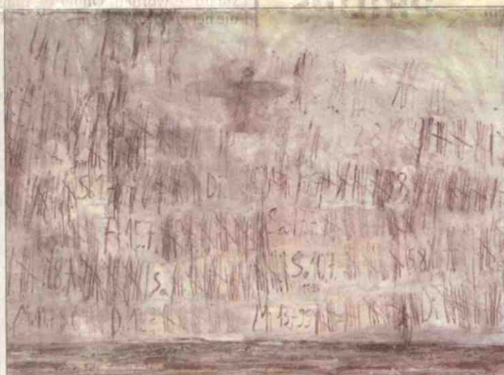
Anselm Kiefer, „Eng zijn de vaartuigen”. © Anselm Kiefer

rie jaar k expo- useum arines. thema bekend en over en over hilderij woeste Berlijn getui- eldoor- pirami-